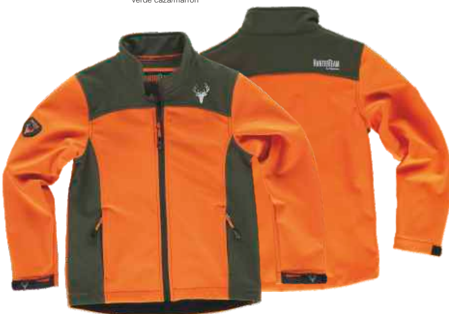
naranja a.v./verde caza

Tejido: 96% Poliéster 4% Elastano (300 g/m2)