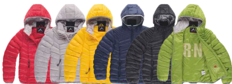
granate perla amarillo oscuro marino negro verde hierba