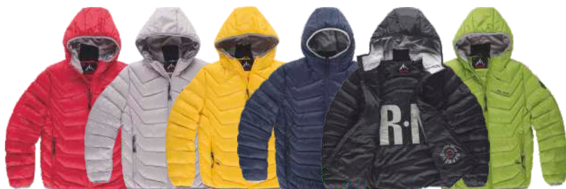
granate perla amarillo oscuro marino negro verde hierba